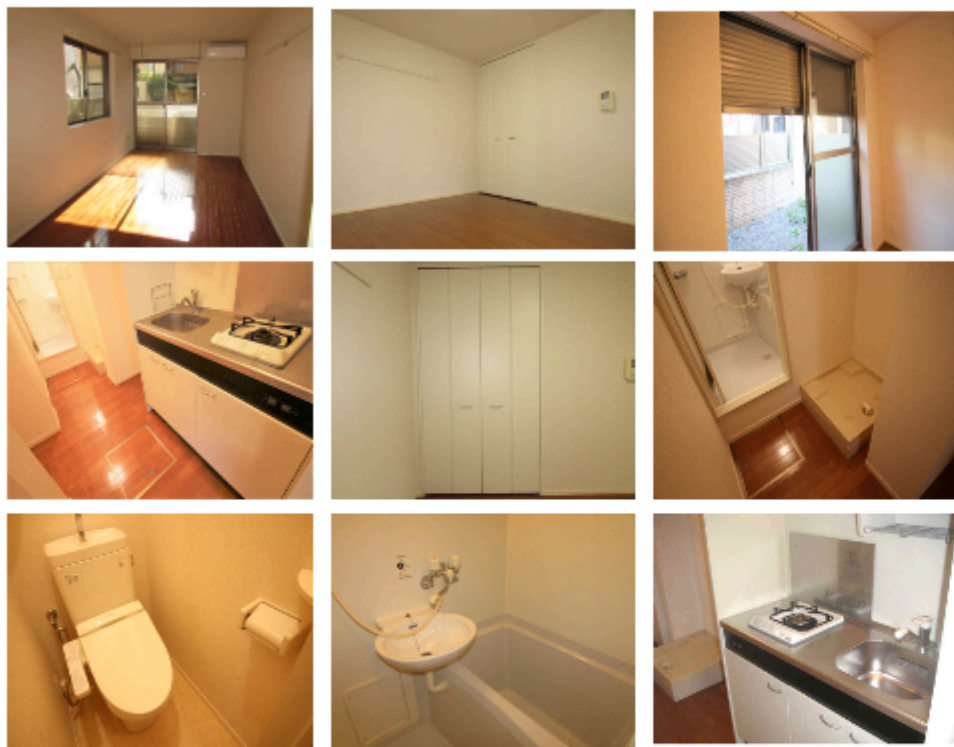
※図面と現況が異なる場合は、現況優先とします。

快適な住み心地と安心安全をご提供のヘーベルハウス キッチンスペースが独立していて使い勝手の良いお部屋 2面採光で明るい日差しが入ります(^_^)/