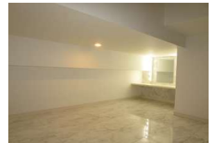
Casa Blanca 101号室