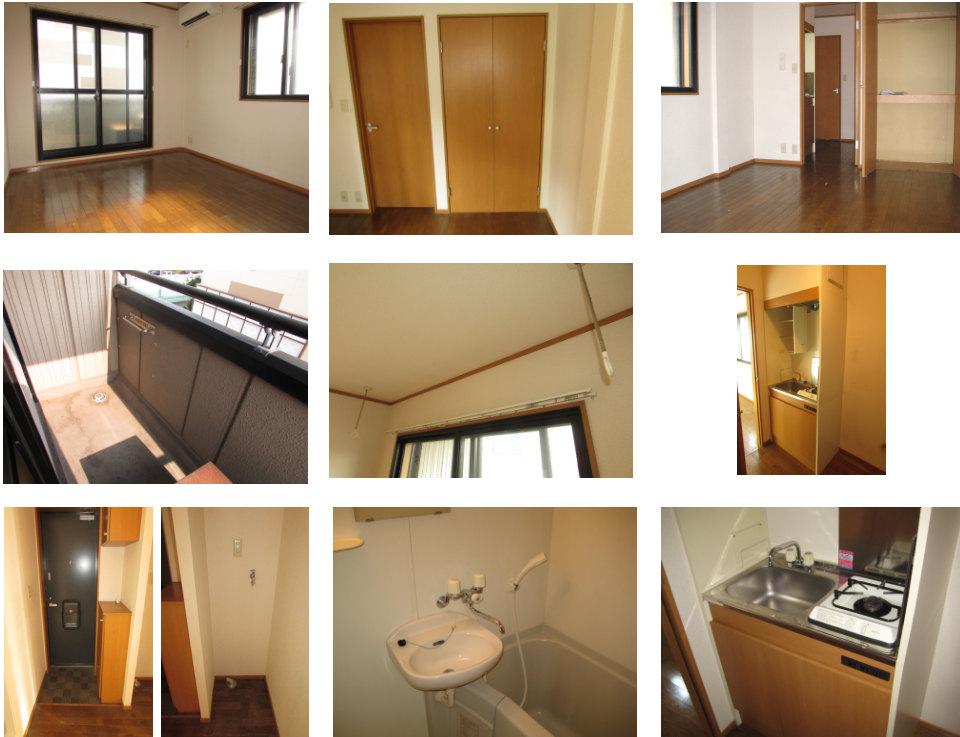
※図面と現況が異なる場合は、現況優先とします。

バストイレ別、室内洗濯機置場と充実した設備です。 自由なレイアウトであなただけのお気に入り空間を！ 南向き2面採光で風通し良好